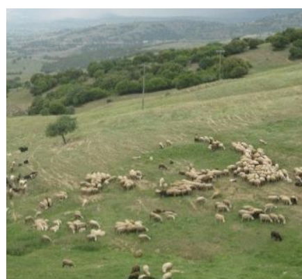
Figura 3. Utilizarea vitezei animalelor pentru identificarea pășunilor de calitate superioară