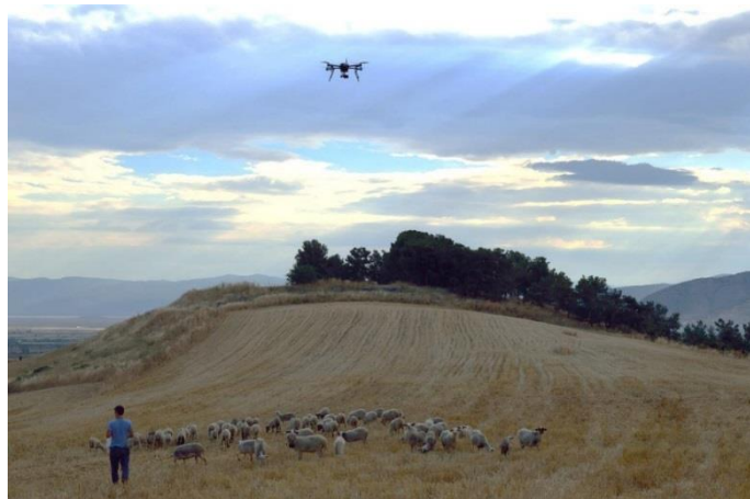
Figura 1. Monitorizarea pășunilor

INTERVAL DE TIMP: 2015-2016 (proiect pilot la Universitatea din Tesalia)