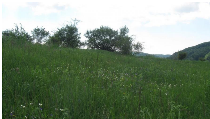
Figura 2. Dealurile Besparski, Bulgaria